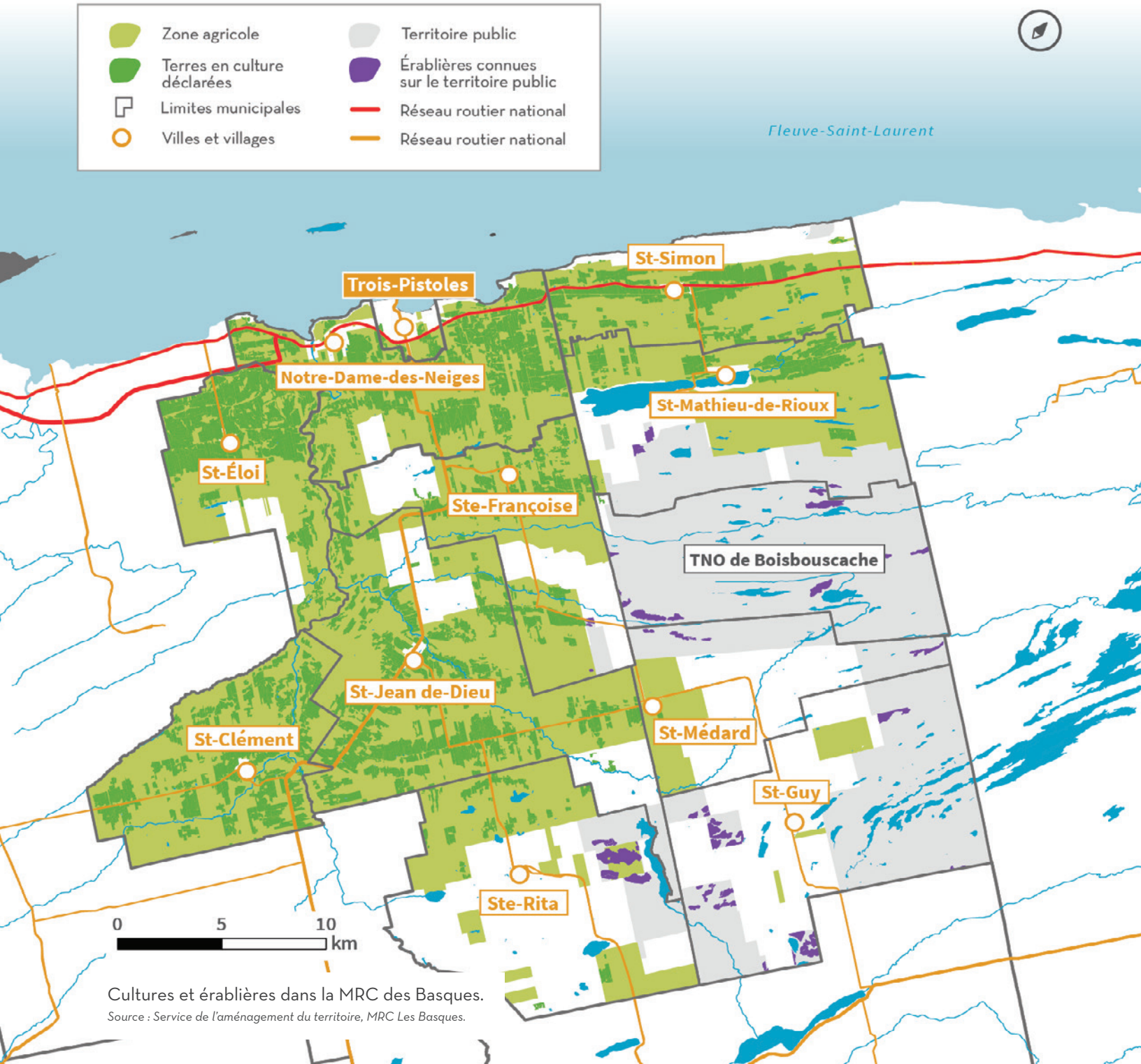
Cultures et érablières dans la MRC des Basques.